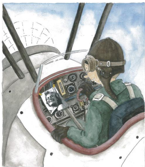
Mati Lepps teckning

Ordförande: Martin Ancons, tel 070-292 94 80, e-post: martin@envengi.com Redaktion: Conny Mörke, Bäverbäcksgård 15, 1 tr, 124 62 Bandhagen tel 073- 581 77 15, e-post: conny.morke@telia.com Postgiro: 94 86 93-7, medlemsavgift 150 kr Hemsida: www.svensklettiska.se