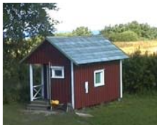
Lilla gäststugan fyra bäddar