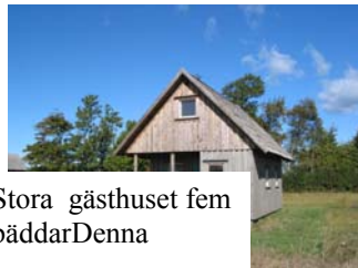
Stora gästhuset fem bäddar Denna